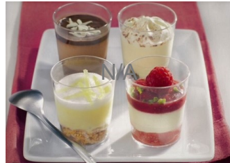
Verrine tiramisu mascarpone café