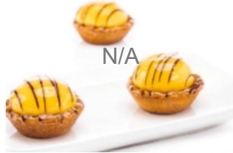
Tartelette dôme au citron 4 cm