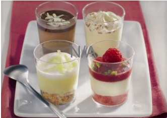
Verrine au citron meringué, crumble