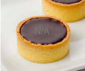
Tartelette chocolat, pâte brisée 18g / 4cm