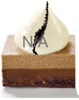
Mousse aux 3 chocolats et feuillantine 20g